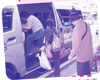
住民に喜ばれている八幡東区・枝光の「おでかけ交通」

10月8日、「高台地区に循環バスを走らせる会」の皆さんが市との協議に臨みました。協議では、「会」のメンバーから「当面の試験運行の早期実現を」、「住民とタクシー事業者との調整を行う市の役割発揮を」と、強い要望が出され、市の担当者は「みなさんの要望をタクシー事業者に伝え、協議したい」と答えました。