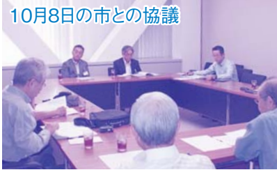
10月8日の市との協議