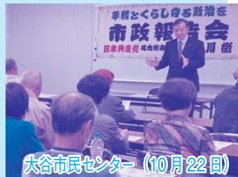
大谷市民センター (10月22日)