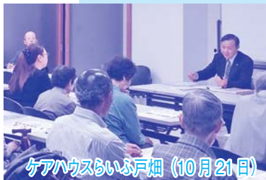
ケアハウスいぶ戸畑 (10月21日)